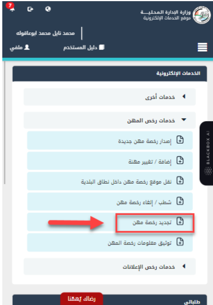
شكل 2: تجديد رخصة مهنة على الجهاز المحمول