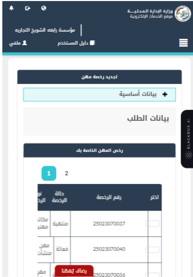
شكل 12 : بيانات الطلب حساب منشأة (تجديد رخصة مهنة) - الجهاز المحمول